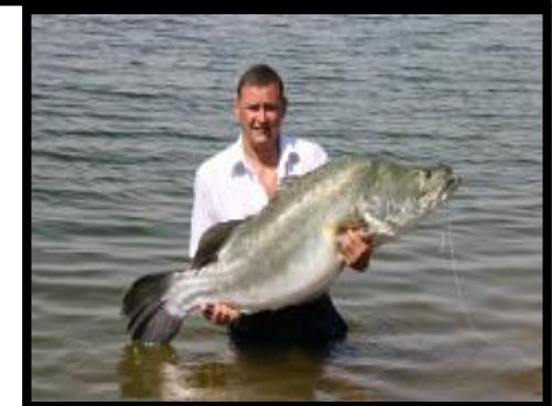
Seite rechts ein 32 Kg und unten 44 Kg Nilbarsch